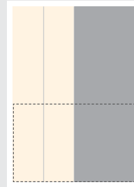
1/2 Seite hoch ■ B 92 x H 272 mm 1/2 Seite quer □ B 188 x H 134 mm