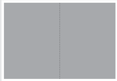
2/1 Seite ■ B 404 x H 265 mm