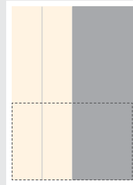
1/2 Seite hoch ■ B 92 x H 272 mm 1/2 Seite quer □ B 188 x H 134 mm